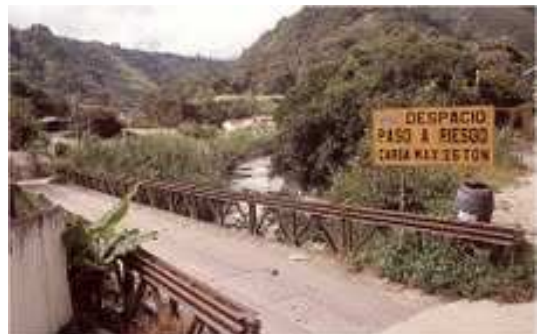
Unterwegs in den Anden

Herr Volkland überraschte die Teilnehmer des Abends mit ausgesprochenen schönen und professionellen Dia-Bildern aus Venezuela. In seiner Reportage durchstreifte er zum einen die Karibikküste und beeindruckte mit bezaubernden Landschaftsbildern aus dieser Region.