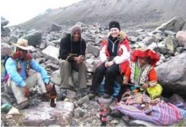
Zwischen Upis und Ausangate auf 5.200 m Höhe bei der Vorbereitung des Opferrituals

die Gedanken und Gefühle anderer Menschen wahrzunehmen. Der wichtigste Schlüssel für die Kommunikation mit ihrem tiefsten Inneren ist, ihre Sprache zu erlernen. Über die verschiedenen Dialekte der Quechua-Sprache, aber heute auch über das Spanische, vermitteln uns die Quechuas ihre Gedankenwelt und lassen uns teilhaben an ihrem Leben im rauhen Hochgebirge, in den milden Tälern und im grünen Dickicht des Urwaldes.