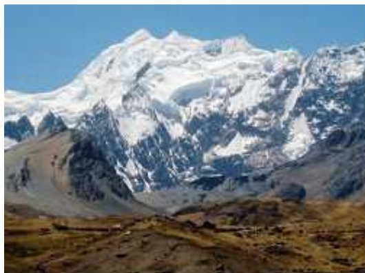
Der Gletscher des Ausangate, 6.384 m Höhe

Offen zu sein für Ungewöhnliches ist die Voraussetzung, um den Reichtum interkultureller Begegnungen zu erspüren und