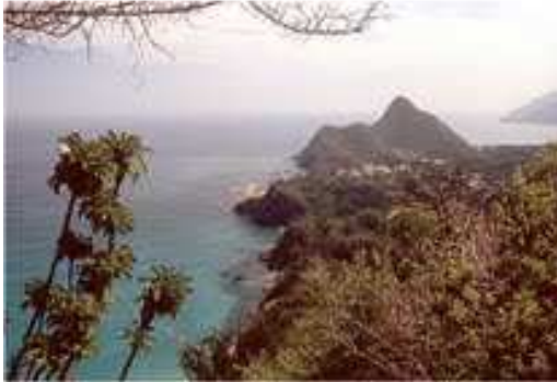
Die Karibik- Blick nach Choroní

„Der fliegende Fotograf“ Ralph Volkland – Walsrode