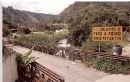
Unterwegs in den Anden

Zunächst besuchte der Fotograf für einige Tage die Karibikregion westlich von Caracas. Dort konnte er die Schönheiten entlang der Karibikküste dokumentieren. Ein Teil der Karibikküste hat er in einem gemieteten Fischerboot mit ortskundigen Einheimischen und Fischern erkundet. Er war auch in den fast undurchdringlichen naheliegenden Bergregenwäldern unterwegs, die bis an der Karibikküste heranreichen und eine Höhe bis zu 1000m erreichen.