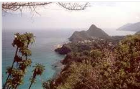
Die Karibik- Blick nach Choroní