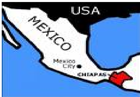
Chiapas und Oaxaca