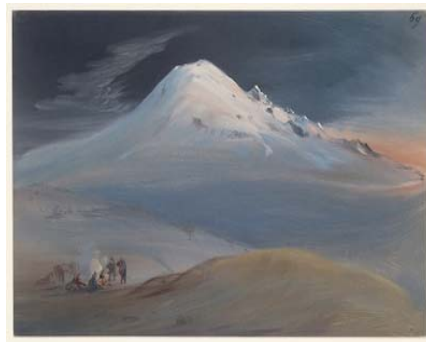
Rugendas: Nächtliche Rast auf dem Weg zum Gipfel des Popocatépetl

Für unsere Gruppe ist eine fachkundige Führung vorgesehen.