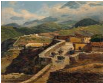
Bellermann: Straße nach Guaira

Alexander von Humboldt inspirierte durch seine Reiseskizzen und Naturstudien über den amerikanischen Subkontinent ganz Europa. Die herausragenden zeitgenössischen Maler Johann Moritz Rugendas, Ferdinand Bellermann und Eduard Hildebrandt unternahmen – angeregt durch Humboldt – in der ersten Hälfte des 19. Jahrhunderts ausgedehnte Reisen nach Lateinamerika. Sie hielten eindrucksvolle Landschaften, Flora und Fauna sowie die damaligen Sitten und Gebräuche in ihren Bildern fest. Das Kupferstichkabinett stellt interessante Bilder, Skizzen und Blätter vom dreijährigen Aufenthalt Rugendas in Mexiko (1831-34), Bellermanns in Venezuela (1842-45) sowie Hildebrandts erster Brasilienreise (1844) aus. Viele davon wurden auf Vermittlung Humboldts für das Kupferstichkabinett erworben. Wir möchten die einmaligen und aufregenden Lateinamerika-Einblicke dieser genialen Maler und Zeichner gern gemeinsam besichtigen!