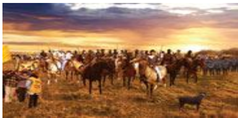
Leonel Luna La conquista del desierto (Der Eroberer der Wüste), 2002